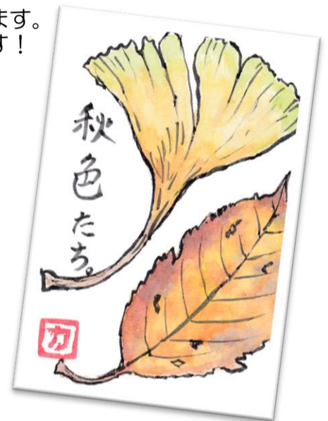
【 八木 しろやま班 】