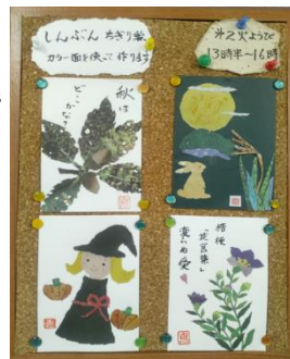
ちぎり絵班の作品