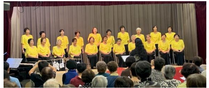
最高90歳、平均77歳ステキなうたごえ!

※グループ名“コーロ・フェリーチェ”はイタリア語で「幸せな歌声」。古市小のママさんコーラスOBです