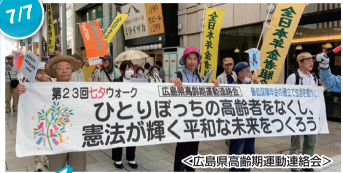
＜広島県高齢期運動連絡会＞