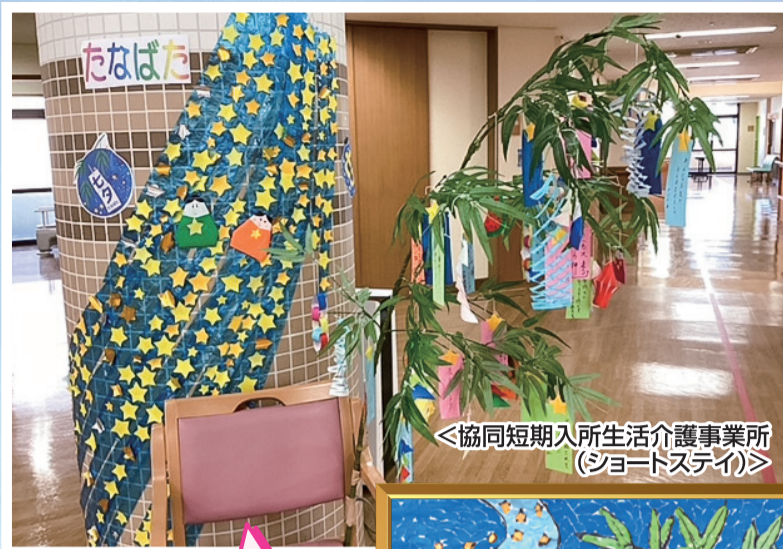
＜協同短期入所生活介護事業所 (ショートステイ)＞

久しぶりの開催で、メニューはちらし寿司♪「とても美味しかった!」「次はいつ?」と大盛況!