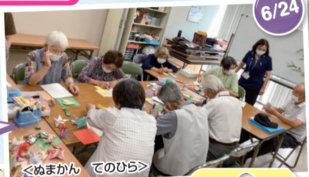
＜ぬまかん てのひら＞