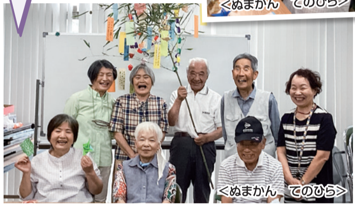
＜ぬまかん てのひら＞

「元気で健やかに」 「ゴルフが楽しく」 「世界が早く終結し 平和が訪れますように」 「できますように」