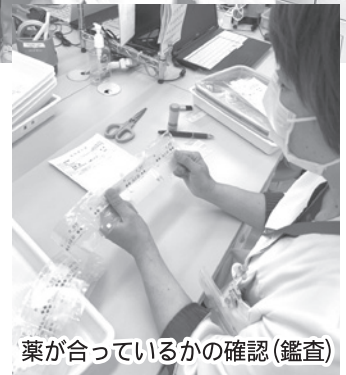
薬が合っているかの確認(鑑査)